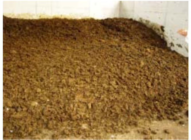
剪定クズ混合堆肥の状況