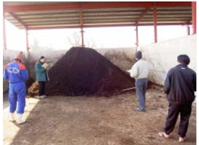
現地検討会の状況