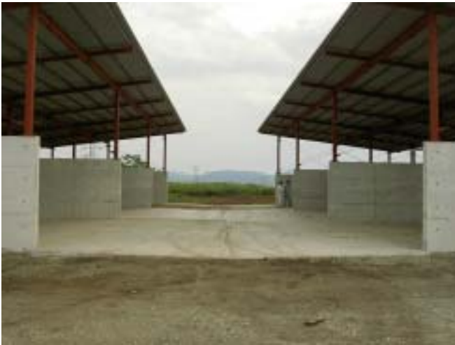
堆肥舎の全景(完成時)