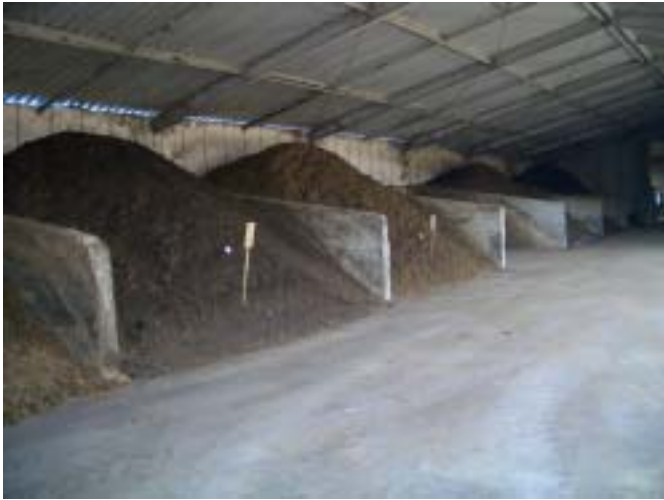
発酵槽の状況（槽毎に温度管理されている）