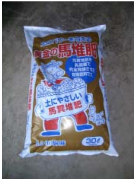
袋詰めされた製品（30L）