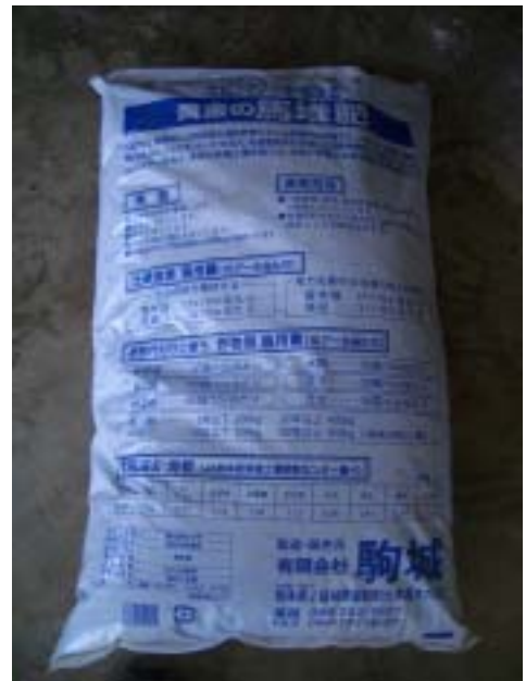
同裏面（使用方法が記載されている）